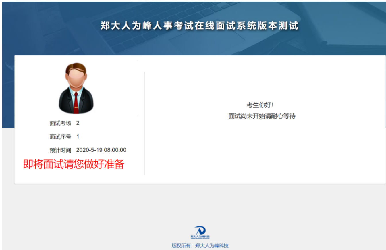
图3 考生等待面试界面

4. 【线上面试】考生接收到面试开始通知后请点击确定进入面试系统，并按照规定要求进行相应操作。