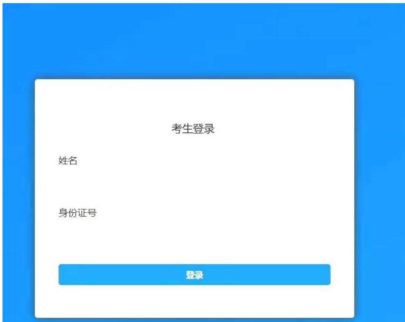
图 1 考生登录界面