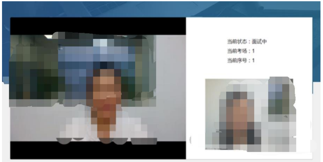
图 5 面试界面